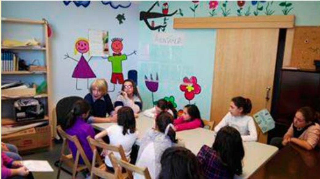
Visita de concejales al Club CDN.