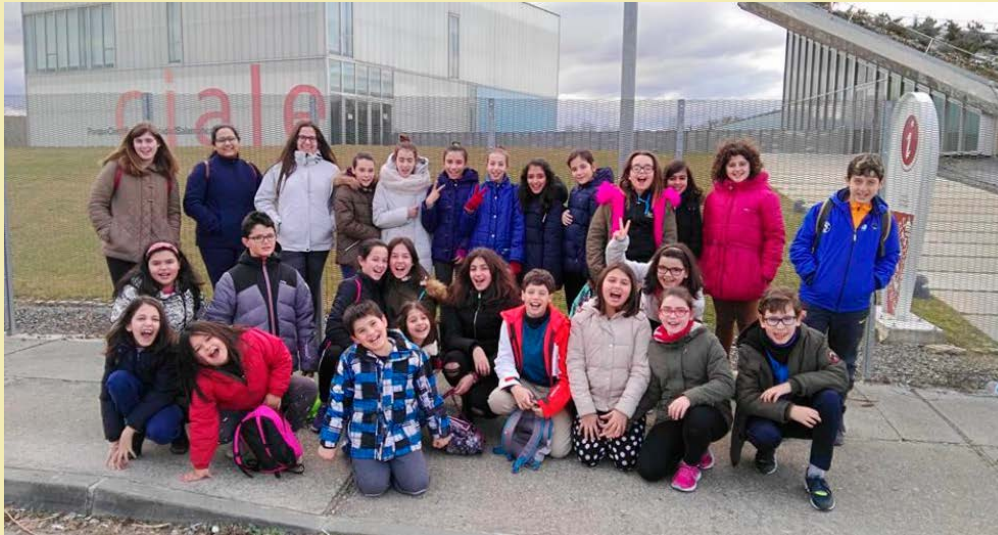
Visita al parque científico de Villamayor.

© CHOUKIZEL DAS LOS NIÑOS FONDOS PARA EL OMBR BELGISE-OT.COM