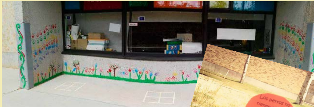
Decoración del CEIP Ciudad de l@s Niñ@s.