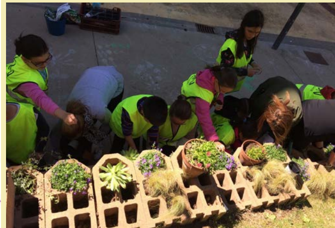
Elaboración de ecomuro.