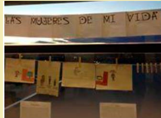
8 de marzo. Día Internacional de la mujer trabajadora.