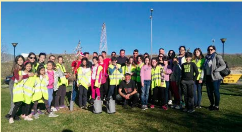
Día del Árbol.