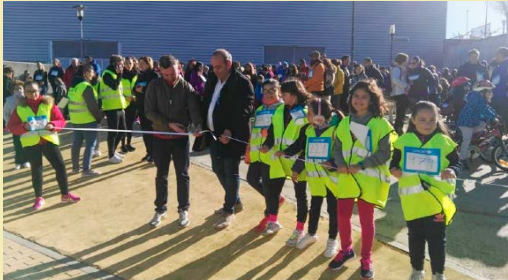
Marcha del agua de UNICEF.