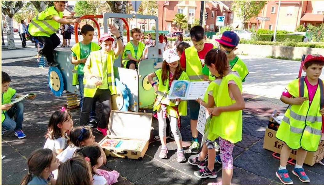
Día del libro «La maleta viajera».