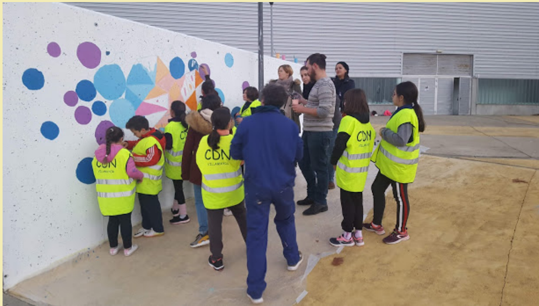
Mural urbano realizado por jóvenes y niños del municipio contra la violencia de género.