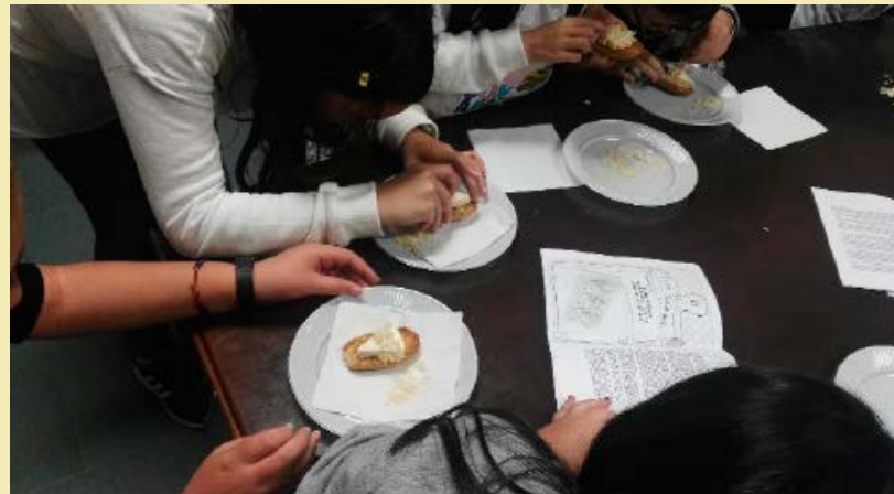
Taller de cocina.