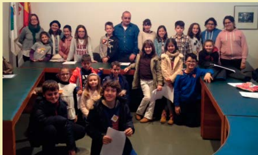
Imágenes de los Consejos de la Infancia. L@s niñ@s de CDN con alcalde y concejales.