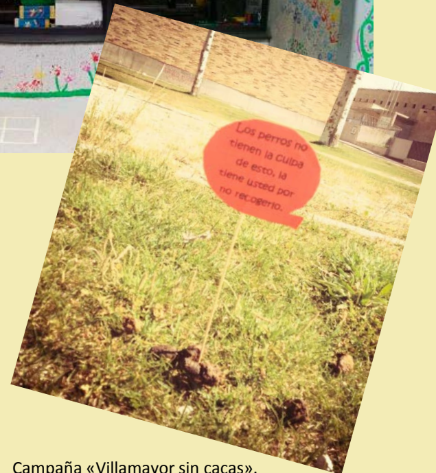
Campaña «Villamayor sin cacas».