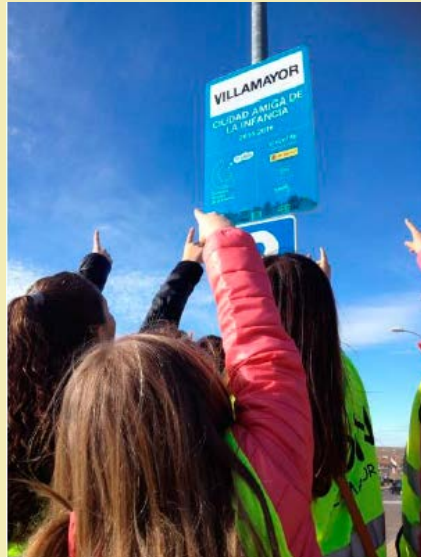
Inauguración de la placa de Ciudad Amiga de la Infancia 2018